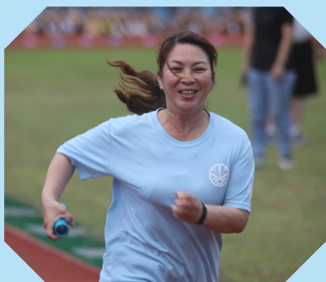
家長會會長參與 74 屆運動會，與學生一同在操場奔馳。

進入春暖花開的四月天，蘭園悄悄的披上了一層綠，望向窗外剛整理好的如茵草地上，調皮的八哥、優雅的喜鵲、穩重的黑冠麻鷺都來覓食湊熱鬧。四月的蘭園，如願綻放出屬於每個藍衫女孩的青春與熱情。