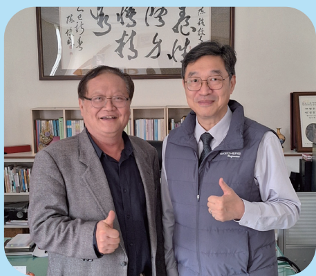
基金會董事長榮任宜蘭縣書法協會理事長，致贈墨寶。