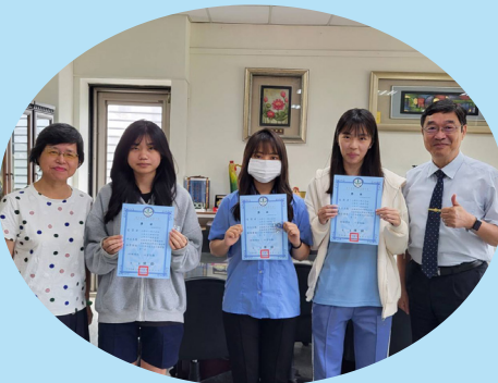
校友會理事長頒發人文行動考察獎狀與獎學金。