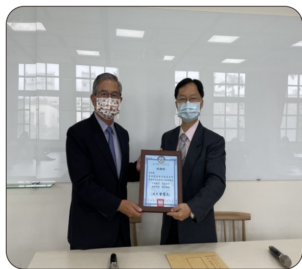
校長頒發感謝狀，感謝財團法人薛長興慈善文教基金會長期發放清寒獎學金鼓勵學生努力向學。