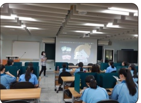
數學科怡均老師點出學生學習上易出現心態與盲點，並分享學習之關鍵方法