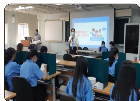
校長勉勵並引導學子們朝正確的學習之路前進

這次的座談活動圓滿落幕，感謝校長的重視與各科老師一直以來投注心力來幫助學生精進學習，支持蘭女學子們的學習步伐走得又穩又遠，培養具備求知精神及自主學習力的學生。相信在入學之際得到教師的幫助，奠定學習策略的基礎，使學子邁向學習之路信心滿滿不慌張。