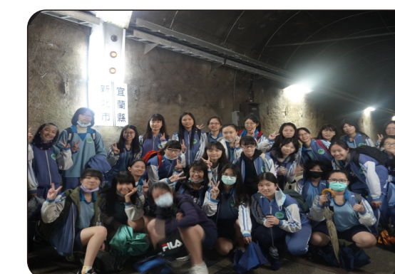
宜蘭新北交界處合影