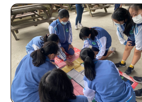
分站探索-智力拼布