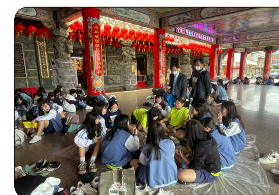
校長與家長會長前來鼓勵同學