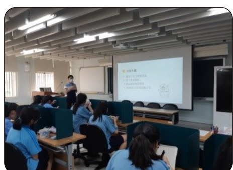
英文科凱傑老師提醒同學需要調整與國中學習型態的落差