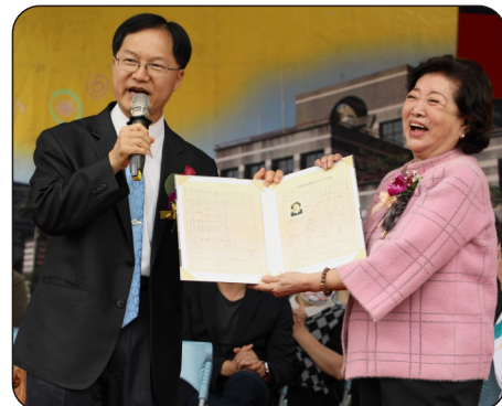
曾璧光校長贈予陳淑芳學姊當年在蘭園時的成績單

畢業於蘭陽女中初中部的陳淑芳女士，以《親愛的房客》、《孤味》兩部電影奪下第57屆最佳女配角與女主角獎，創下金馬獎的榮耀紀錄。學校特別在83週年的校慶，頒發傑出校友給予陳淑芳女士，表彰其在演藝圈的卓越貢獻，堪為學妹表率。曾璧光校長也特別準備了當年的成績單送給陳淑芳女士，證明優秀的表現從年少時就有跡可尋。