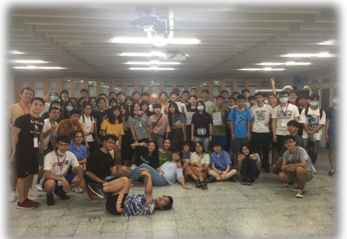
太陽能汽車工程營全體合照