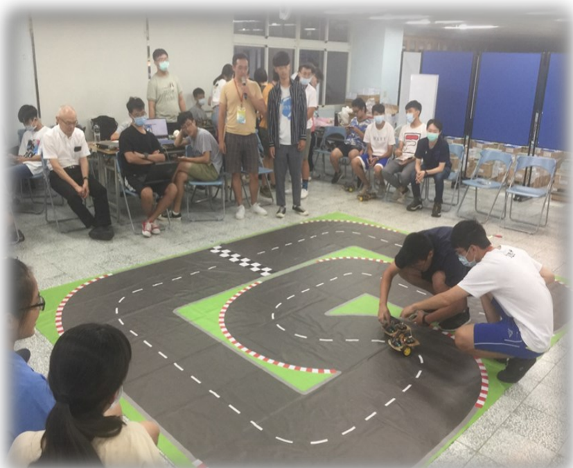
學生使用手機遙控小電動車

營隊特色在於推動綠能科技融入學習，學生經由學中做、做中學及競中學，養成「主動探究」的學習精神，提升科學興趣與素養，期許培育未來綠能科普人才。課程內容從目前世界使用的能源切入，探討能源短缺與全球暖化的議題，並簡介各種車輛電氣化的發展及未來展望。另外以實作小太陽能車與手機遙控的小電動車，讓學生了解車輛的基本構造與控制方式，並藉由比賽凝聚團隊合作精神。