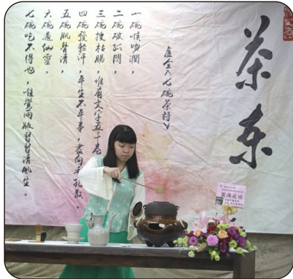
選修茶道課同學展示茶道