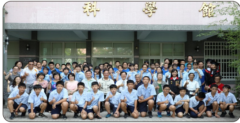
課程發表會全體與會師生及來賓合影留念