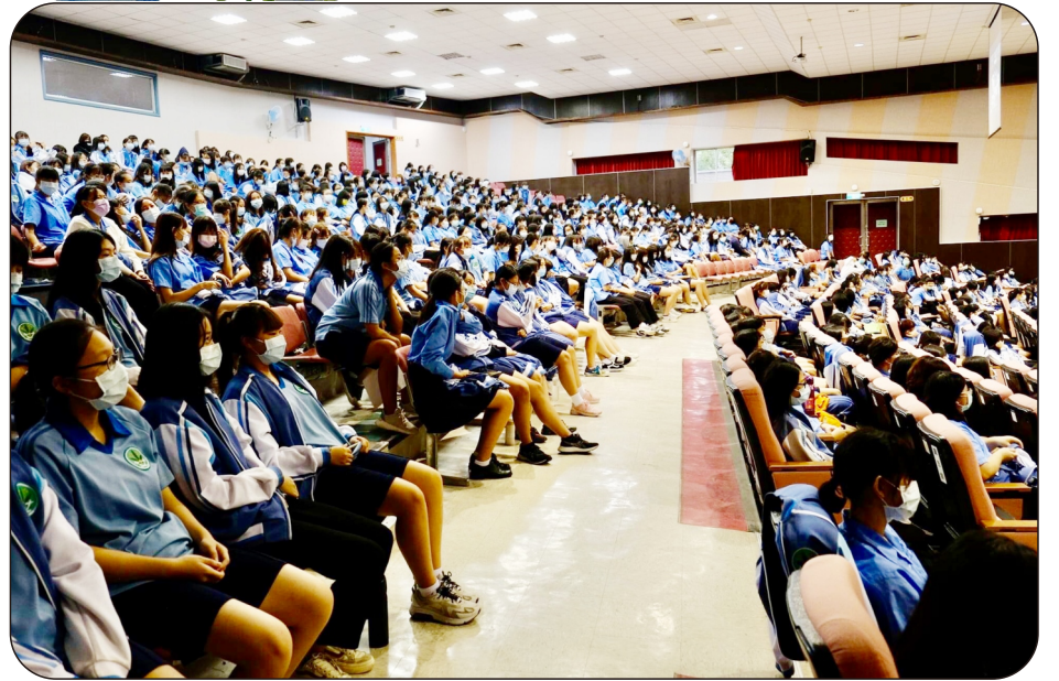
全體同學共同參與捐贈儀式