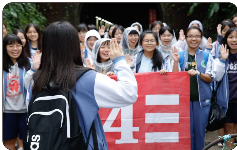
304班同學進行成年禮宣誓儀式

成年禮活動當天陰雨綿綿，卻絲毫澆不息學生們的興奮之情。慶幸的是，學生進行誓師時雨勢減小，得以順利完成各班的宣誓儀式。活動一結束，天空瞬間降下傾盆大雨，彷彿依依不捨著家鄉子弟將揮別故鄉離去。縱使雨勢滂沱，師生們仍珍惜難得共同出遊的機會，師生的溫暖情誼變得更加緊密，增添美好回憶。