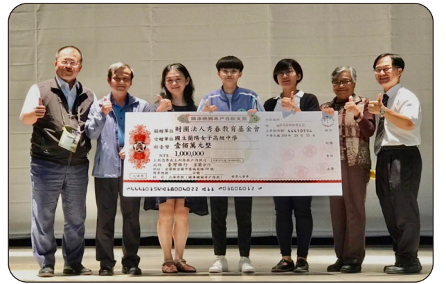
秀春基金會捐款活動之合影