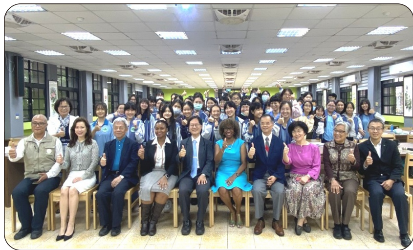
會後全體師生與來賓合影

一小時緊湊的分享與對談帶給蘭園學子相當特別的體驗，也為世界各國正處於疫情環境之中，帶來不一樣的國際交流。