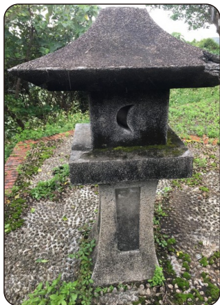
神社參道的石燈籠

此趟研習活動不僅讓教師們吸收更多的專業知識，也拉近教師自身與在地鄉土的距離，獲益良多。期盼將來有機會把在地文化融入學校課程之中，向學生傳遞宜蘭故事，體會家鄉之美。