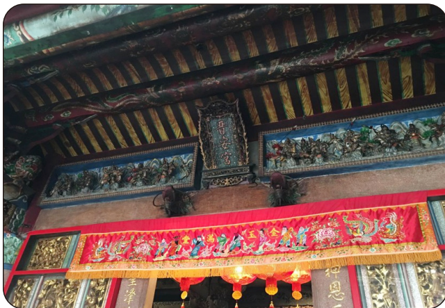
香火鼎盛的蘇澳晉安宮