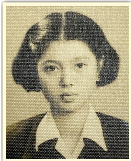
陳淑芳當年入學的學籍資料，長相十分清秀。

81歲陳淑芳演戲63年，首度奪下金馬獎，以《親愛的房客》、《孤味》二部電影同時獲得最佳女主角與女配角。陳淑芳於1952年入學蘭女初中部，1955年畢業。陳淑芳本名陳笑。當年陳爸爸去幫她登記名字時，忘記原先要取什麼名字，「因為她很愛哭，就叫做『笑』，取名陳笑」。陳淑芳演了63年的戲，人生遇到不少挑戰，如今得獎，實至名歸。陳淑芳校友勇奪金馬獎時，表示「我是演員，我不是明星」、「那怕是一場戲、一句話，我都會演」，令人相當感動，這樣敬業的精神跟專業態度，是後輩學子學習的最佳典範。