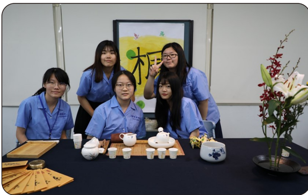
茶道課程發表會茶席主題佈置