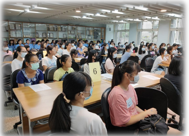
學生參與科學營活動