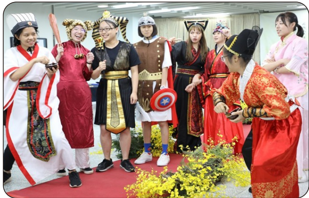
高三同學以古裝人物代表不同的蘭園植物

茶會的最後高潮為曲水流觴方式，邀請與會來賓在國樂聲中依古例傳茶杯，樂聲停止，手上握有茶杯的人則上台玩遊戲，既益智又讓整場茶席洋溢著笑聲。最後大家在依依不捨互相感謝的祝福中，結束這場別具意義的課程發表茶會。