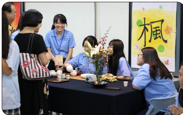
學生及與會來賓一同參與品茗活動