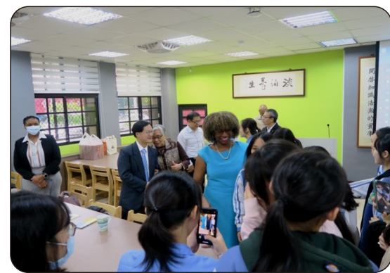
由左至右：柏安大使精彩演說、學生排隊與柏大使照相留念