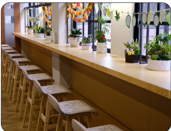
圖書館窗臺閱讀桌