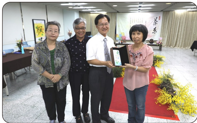
學校社群老師獻上蘭園植物地圖