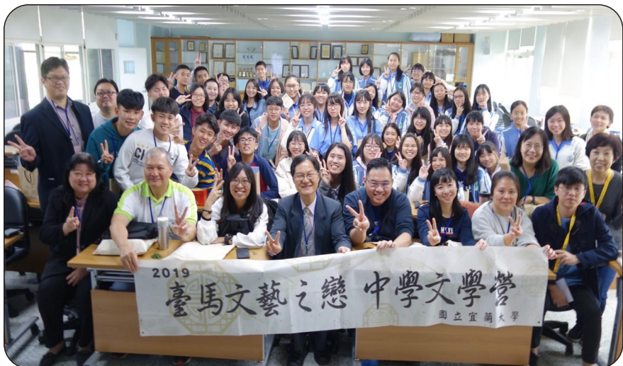
師生共學，成功的國際教學交流與分享

在感受、見習、再感受、澄清、梳理、沈澱、創作的動態流轉中，培育學生對週遭環境的理解、關心與重視，是一堂成功的素養導向教學，也成功地帶領學生建立起環境感知與文學創作的連結，正是符合素養導向教學所注重的知識、能力、態度與價值等四面向之元素與內涵。