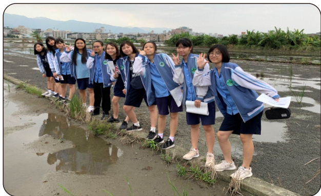
捲起褲管，親近腳下泥土

「新詩下午茶」——談詩，談寫作，談生活，談你我，連結讀詩與生活，談創作與分享，以跨校交流的方式，學習賞析與創作。藉由走進市場、田園與日星鑄字行，寫作人物詩、田園詩與圖像詩，並透過詩歌朗誦的發表，讓學生享受讀詩、寫詩的日常，為偶爾可能憂鬱、迷惘的青春心靈找到一首生命力的「詩」。