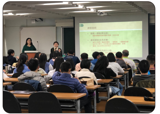
以木部十二畫為主題的課程研討