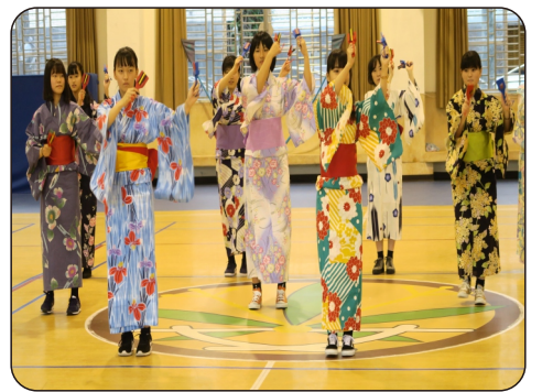
櫻花高校學生傳統舞蹈