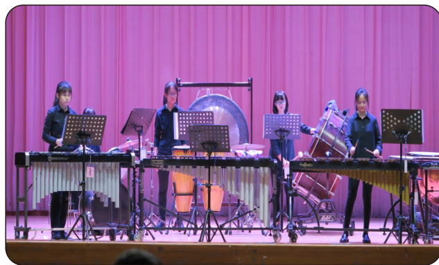
管樂社參加打擊樂合奏組比賽