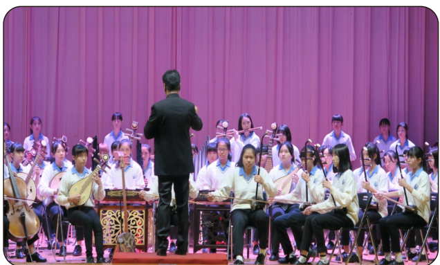
國樂社參加國樂合奏組比賽

本校除注重課業學習，同樣重視藝文素養的培育及啟發，以達成校訓「求真、行善、崇美」的期許。因此歷年來投注相當資源於校內藝文性社團的經營，如今開花結果，獲得卓越的成績。