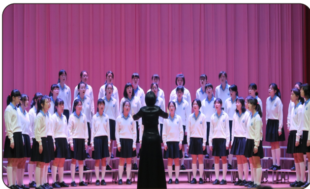
合唱團參加女聲合唱組比賽