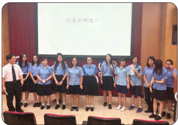
107年5月29日語文資優班專題成果發表活動 地點：圖書館5樓演講廳

語文資優班發表中英文創作作品集《洄聲》，與區域內各級學校分享，提升學生文藝素養。今年5月份亦辦理學生專題成果作品發表會，邀請縣內各國高中蒞校交流觀摩，透過成果發表會，提升學生表達能力，並將學生三年學習成果與國中生分享。此外，高二學生英文課以教學單元方式進行英語會話與編劇等課程內容。由學生發想劇目內容，參考可供改編的故事，教師從旁協助學生進行編寫與劇本潤飾，繼而分組排練，最後利用班級活動時間以團體競賽方式交流暨成果發表，學生反應熱烈，全縣受惠師生達千人以上。