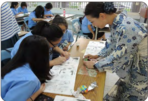
(圖左)老師教授以日本彩紙，摺出承載著希望的紙鶴。

藉由文化交流，讓同學對姐妹校有更多的認識，也開闊視野、豐富見聞。參與兩天的體驗營，同學都收穫許多。