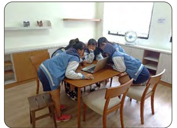
學生自主學習討論室使用狀況

歡迎蘭園的老師、學生多加利用圖書館的自主學習討論室，讓書叢深處時時充滿知識交流的討論聲。