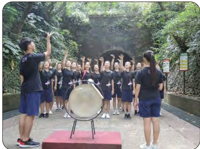
(圖左)314班宣誓：由每班的宣誓代表唸出班上的誓詞，並敲響鑼，象徵同學的夢想將伴隨宏亮的鑼聲，展翅翱翔！

「成年禮」對高三同學而言，別具意義。透過舊草嶺隧道健行，培養「獨立」、「堅持」的態度。從隧道南口步行至北口，也象徵升上大學後，同學將離開宜蘭，脫離父母的保護。期許同學們，不論未來離家多遠，依然能謹記成年禮「堅持不懈」、「獨立自主」的精神，體會出「成年」，不只是年齡增長，舉凡待人處事的態度或遭逢挫折逆境，都能勇敢自信、從容以對，使自己真正的「轉大人」！