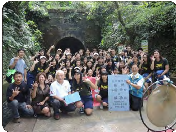
(圖右)發放309班「追分成功」車票卡：同學在小卡上寫下對自己的期許，並黏貼於車票卡後。祝福所有高三同學都能追分成功！