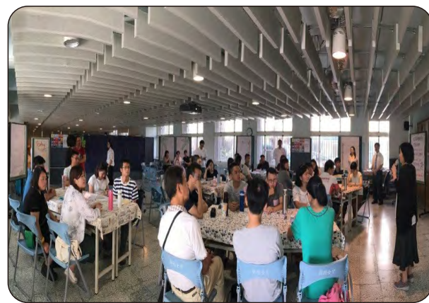
107年5月21日跨校跨領域素養導向研習工作坊 地點：科學大樓