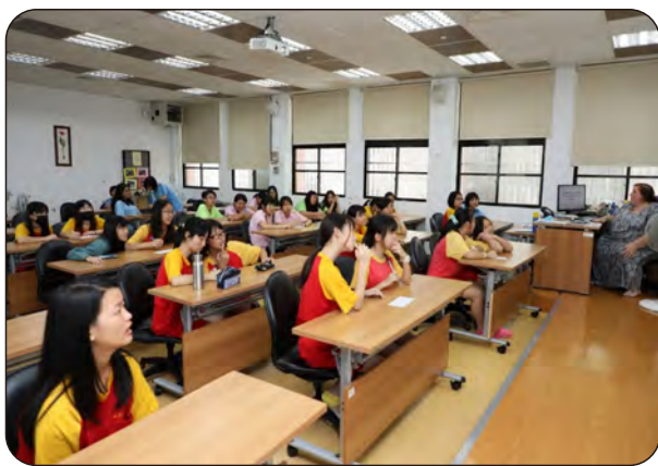
107年5月30日蘭園體驗活動外師課程 地點：紅樓視聽教室