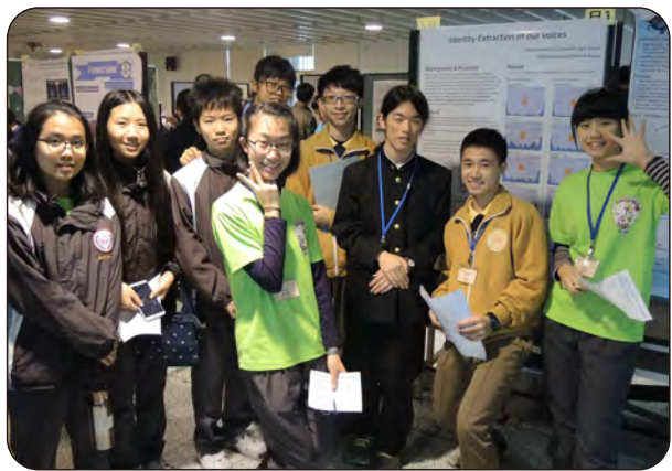
106年12月26日台日科學論壇活動(船橋高校生) 地點：科學大樓

日本「超級科學高中 (SSH)」船橋高校至本校進行全英文科學對談交流，蘭女也將此交流機會與友校共享，廣邀縣內羅東高中、復興國中、國華國中和中華國中等四所國高中學生和日方學生一起切磋，超過兩百名學生齊聚聊科學。專題交流由該校校長親自帶隊，包含有數學、物理、化學、生物、地球科學及應用科學等領域。這次台日學生的作品共有29件，日方14件，台方則有15件，交流作品內容豐富多元且別具意義，除專題研究交流外，校方還特別邀請中研院日籍研究員太田欽也博士到校進行科學講座，講題是「盲鰻、金魚和我的演化發育生物學」。演講期間，也樂於至台下和縣內國高中學生一起研討，透過交流，可增加台日國高中的學術視野、精進科學視野，並增加情誼，建立夥伴關係。