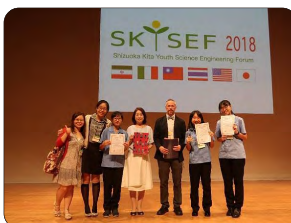
榮獲「環境組研究發表第一名」