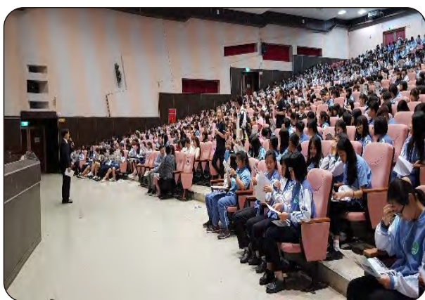
107年5月9-10日舞蹈成果發表及創作展演 地點：大禮堂