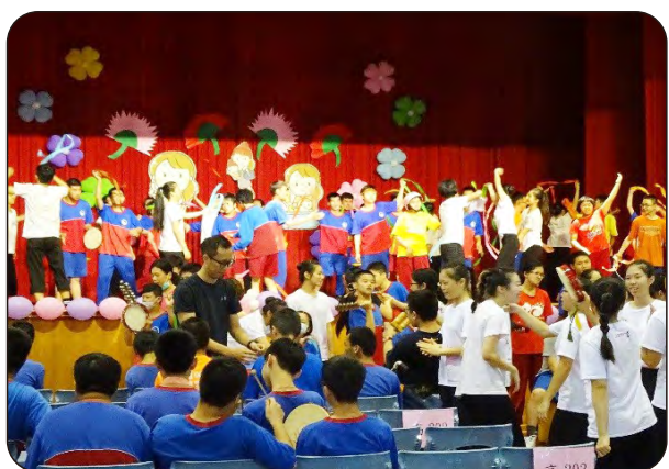
107年5月7日舞蹈成果發表及創作展演 地點：宜蘭縣特殊教育學校

辦理跨校藝術展演活動，參與人數達5,000人以上。透過多元的藝術展演活動，以及免費索票、藝術下鄉的方式，讓更多人親炙表演者的丰采，進而欣賞藝術之美。未來將持續提供宜蘭地區民眾舞蹈藝術觀賞，並固定與宜蘭特殊教育學校合作，首推藝術治療的活動，讓學生必須學習不同的溝通技巧，設計符合服務對象的肢體表演方式，並將藝術帶到偏鄉，培養舞者扶弱濟世的精神。