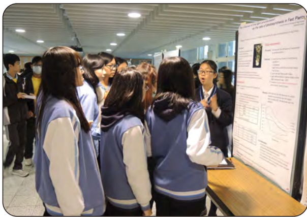
106年12月26日台日科學論壇活動(國中生) 地點：科學大樓