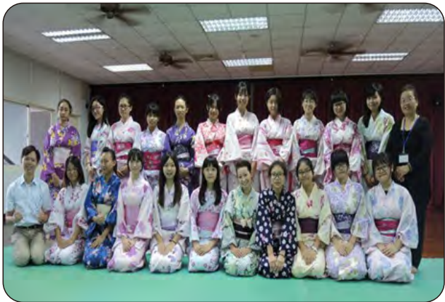
(圖左)學生著浴衣體驗日本傳統文化。