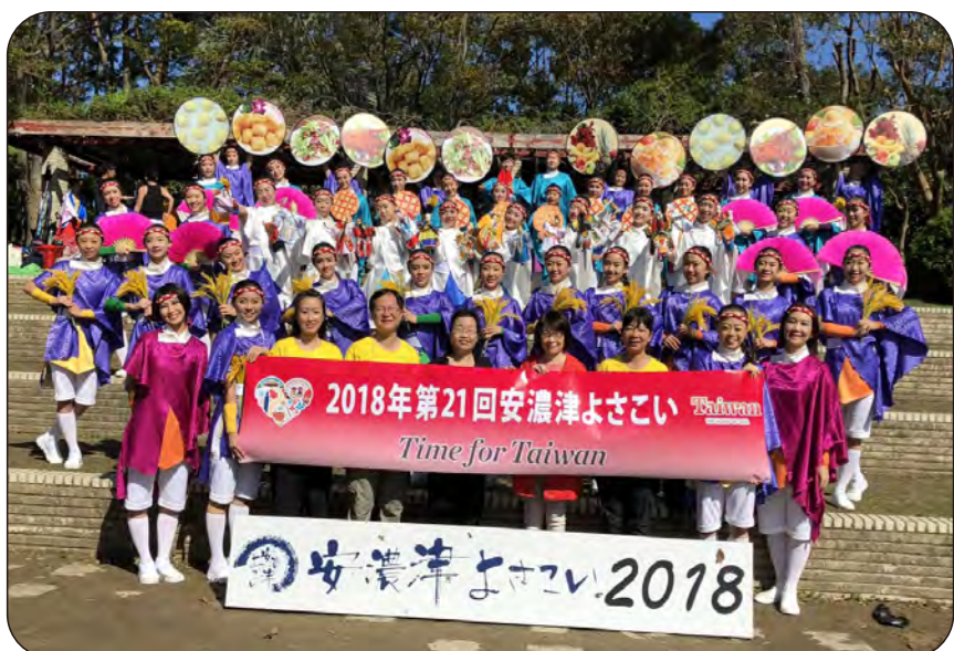
與校長及校友會理事長合影

在五次踩街行程中，大家不斷互相提醒、彼此加油打氣，伙伴間的鼓勵，是支持大家的動力。途中，天空時有陰暗，奇妙的是，有幾次太陽突然露臉，像閃光燈一樣照向我們，猶如陽光幫我們充電般，突然覺得身體充滿了力量！這種神奇的感覺讓我們印象深刻！