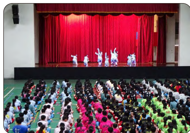
107年5月23日·舞蹈成果發表 地點：宜蘭縣立頭城國中