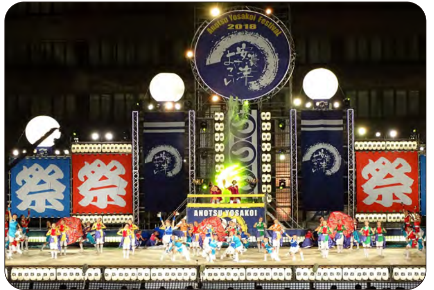
在安濃津城西公園主舞臺上演出