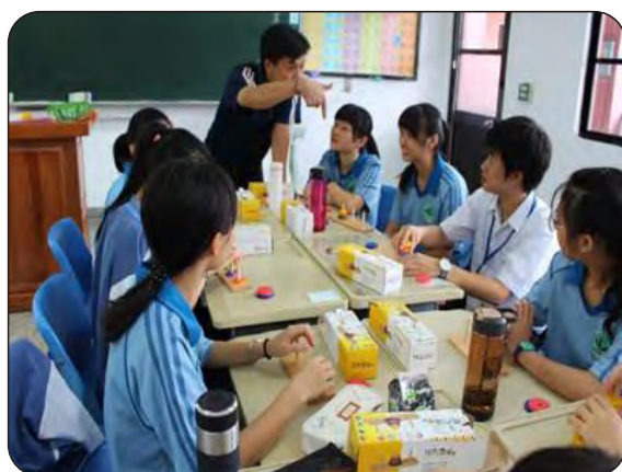
數學課—「河內塔」原理介紹及實作