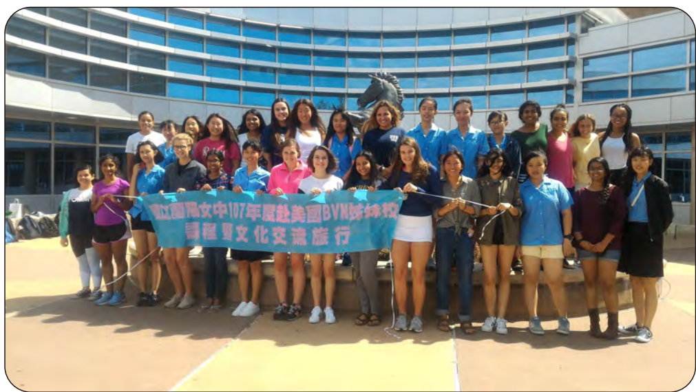
在 BVN 校門口合照

在全球化的趨勢下，年輕學子的學習已不再侷限台灣，兩校的交流提供蘭陽女中師生國際學習的平台，開闊學習的視野，讓蘭園師生與國際教育趨勢一起成長。