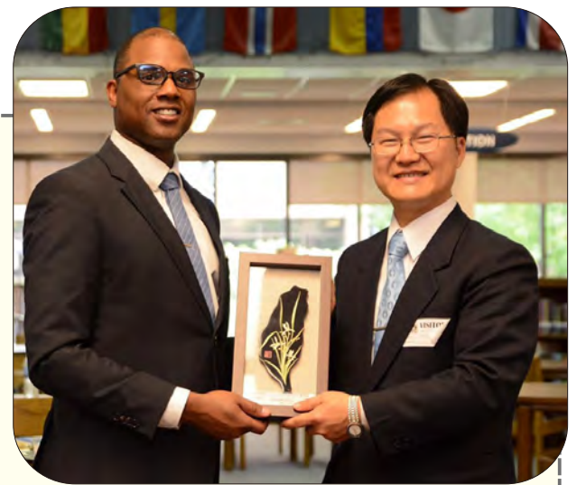
本校與美國 BVN 高中締結為姊妹校

「成就品格」與「道德品格」在具體的展現上，有八項優勢能力可做為教育目標：終身學習與思辨者、勤奮又有能力的表現者、處世圓融且具備情緒管理的能力者、德行的深思想者、尊重且負責任的道德實踐者、自律且追求健全生活方式者、對社區和民主發展有所貢獻者、用心追尋人生崇高目的的靈性者。下期將分享培育此八項能力的方法。品格的培育是終身學習的過程，是需要環境的實際演練，也需要道德智慧的厚實根基，讓我們一起努力，務實而堅持地朝向更優質卓越的品格者邁進。