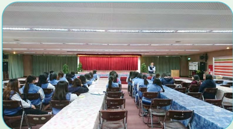
▲內湖副廠長介紹全台第一座焚化廠及相關職業，提供同學們生涯選擇的參考。之後分成兩組認識中央控制室、垃圾場、焚燒垃圾情形以及廚餘、底渣等。