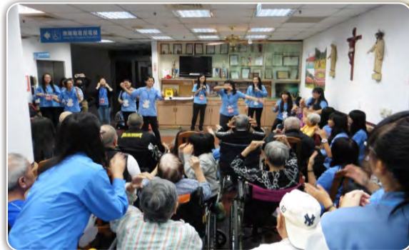
藍衫女孩前往馨遠之家用熱情的活動與表演陪伴原住民爺爺奶奶

寒溪國小的小朋友很活潑，對我們也很熱情，一位小學生問我：「以後我也可以上大學嗎？」我期許能用我的知識幫助他上大學。我們唸《白雪公主》、《灰姑娘》等童書給她們聽，她們聽得津津有味，露出喜悅的表情。三天後我們要離開時，小朋友很難過地拉著我們，捨不得我們離開。