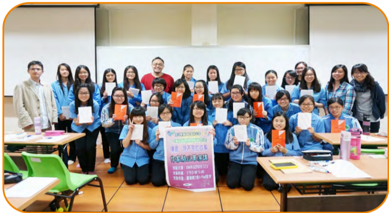
駱以軍演講〈說不完的故事〉

閱讀，不只「讀完一本書」，重要的是閱讀之後的改變與行動。誠品鼓勵學生能從閱讀中養成分享的概念，從分享的過程培養自主性，延續閱讀，深化涵養。本校語文資優班參加「誠品創意閱讀計劃」，讓成果發表融合了「閱讀分享」與「服務學習」，呈現不一樣的特色。