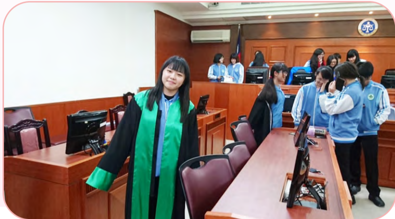
▲學生們試穿法袍，感受法官神聖的使命！