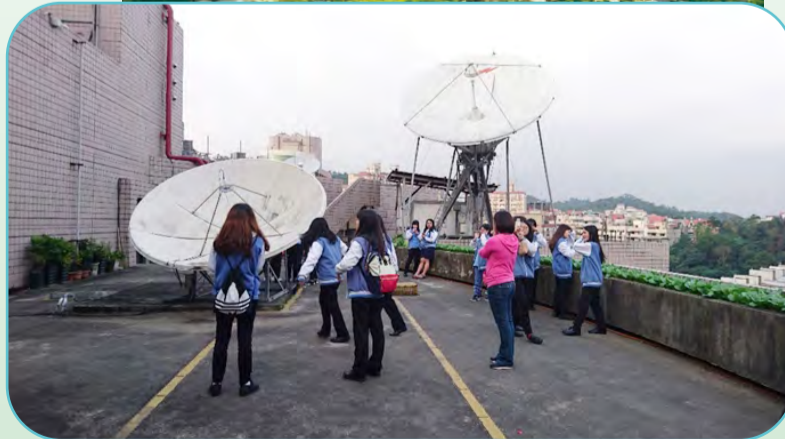
▲衛星天線發送與接收

參觀公視之後，看到小小電視機裡大大的攝影棚，也見識節目幕後繁瑣的製作程序，讓想走進幕前幕後的我相當開心！