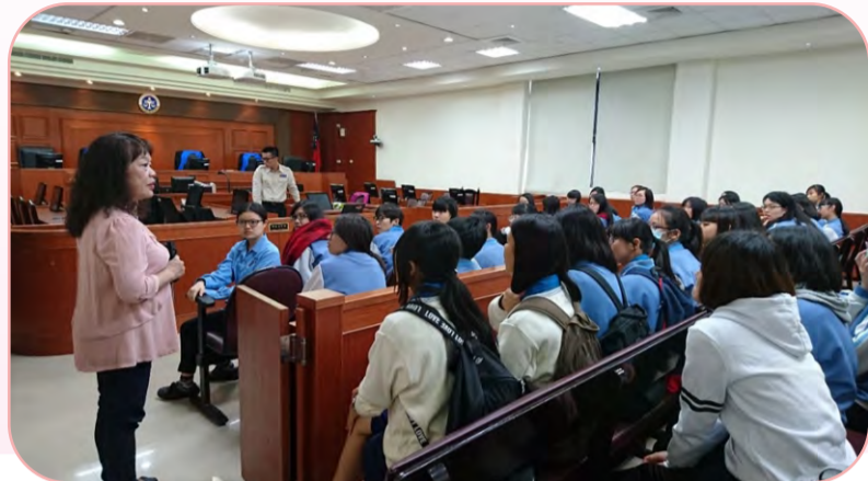
▲訴訟輔導科科長介紹模擬法庭