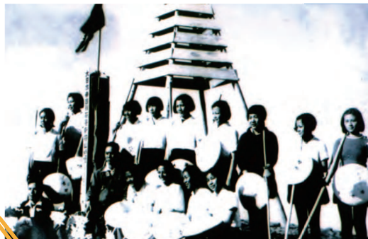
蘭陽女中一回升新高山(玉山)登山照片， 昭和15 or 16年(民29 or 30年)夏天