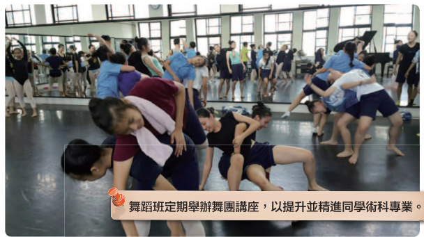
舞蹈班定期舉辦舞團講座，以提升並精進同學術科專業。

舞蹈班於104.09.16(三)參與由宜蘭縣文化部主辦的「羸舞劇場暨舞蹈推廣計畫」，由台灣第一全男子舞團，無限創意的集體創作、精準到位的舞蹈肢體表現，展現獨樹一幟的舞蹈劇場風格，獲紐約時報「迷人、充滿想像力、來自台灣全男子舞團」的讚許，並獲第六屆台新藝術表演藝術類大獎。舞蹈班114、314參與交流後，整個舞蹈班受到很大的激勵！尤其對今年114班的兩位男舞蹈班同學來說，更是一次很特別的體驗！