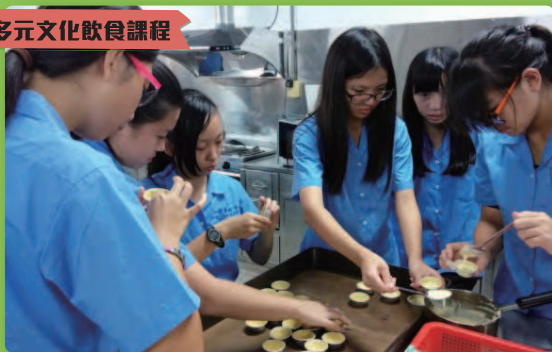
泡芙烹飪實作及以投影片介紹英國飲食文化