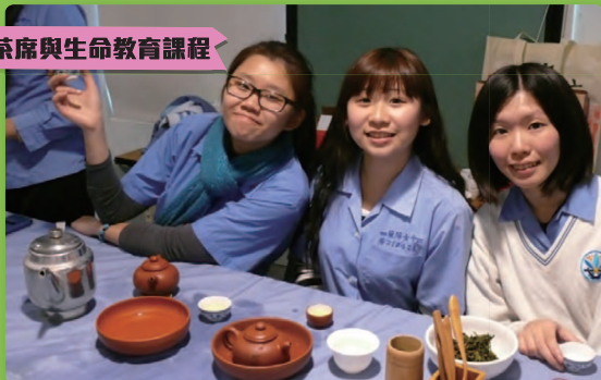
舉辦茶席活動，讓學校師生體驗茶道文化藝術