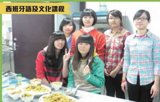
老師指導學生烹調西班牙菜餚並說明該國文化特色