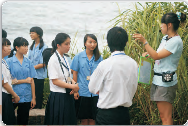
日本安田高校交流活動