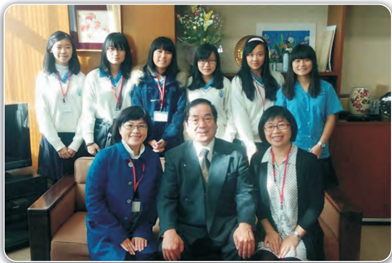
2014赴日參加姊妹校日本安田高校SSH(超級科學高中)研究發表會