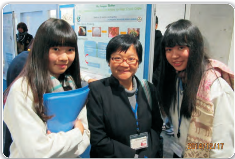
2014日本國際科學工程研討會(WalSES)專題研究海報發表第一名

近年蘭陽女中致力於國際科學交流，除了每年有來自日本的夥伴學校進行科學交流、赴日本姊妹校科學發表，在各項國際科學論壇中亦嶄露頭角，佳績頻傳，深獲肯定，相信蘭陽女中的孩子在國際交流的重要舞台能擁有自己的一片天。