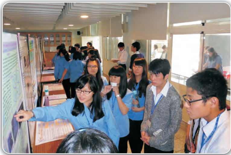
2015日本船橋高校科學交流活動