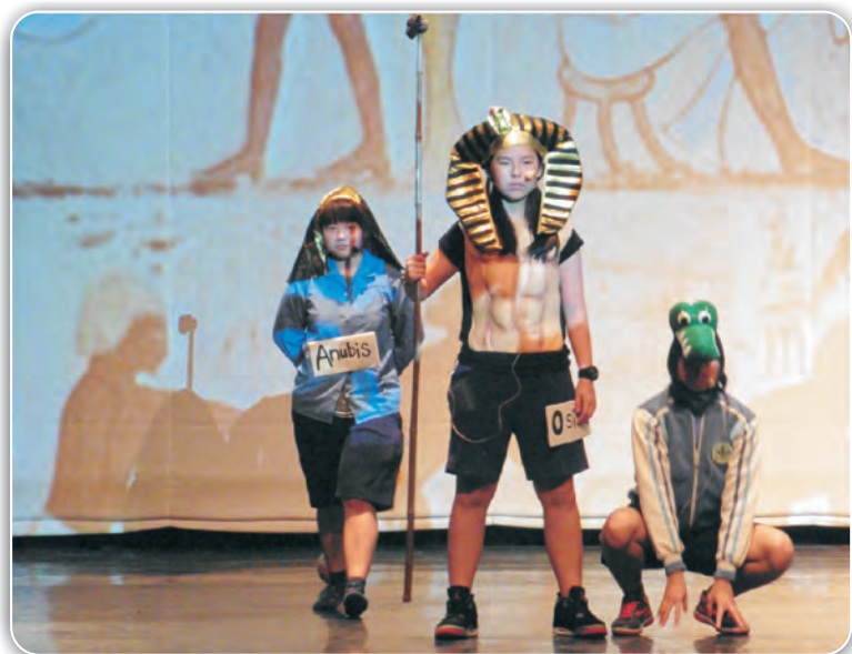
主旨：為增進本校學生英語口語表達能力，提升學習英語興趣。