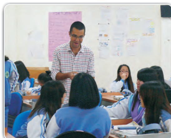
常春藤及空英外師上課情形。提升學生英語文的能力。