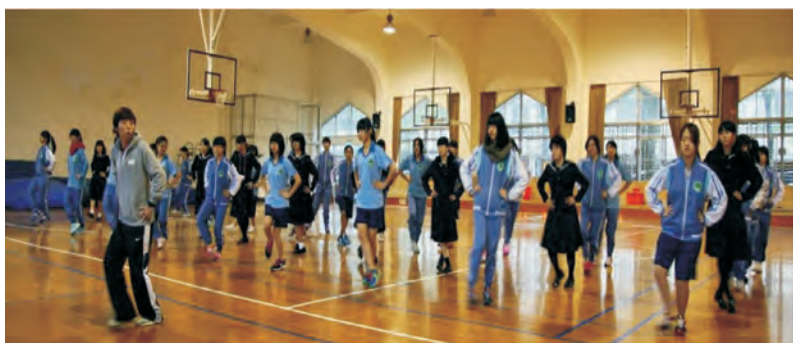
體育課之土風舞體驗

接著於本校大禮堂，邀請本校著名社團：國樂絲竹團、吉他社、烏克蘭麗麗、街藝社、合唱團等表演，分享本校學生的課外才華，日本學生亦換穿日本和服，表演當地舞蹈以回饋蘭園。傍晚，全校學生在晚舞音樂聲中與日本櫻花高校學生翩翩起舞，共創美好回憶。