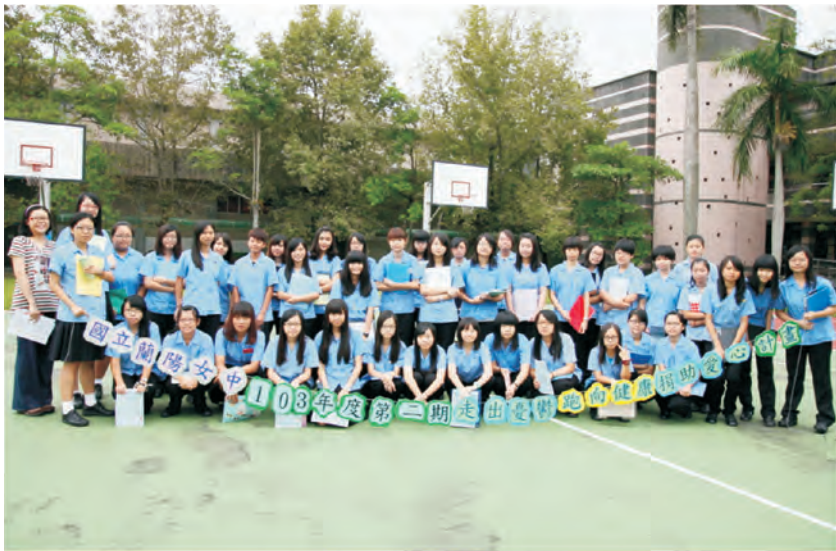
參加第二期「走出憂鬱、跑出健康、捐助愛心」活動同學合影留念

為推廣「運動可以提升學習效果、有效紓解壓力，進而促進身心健康」的理念，並考量本校多數學生因課業繁忙而未能養成規律運動的習慣，因此提出本計劃，邀請全校師生及家長自由意願加入，透過在校園持續健走及跑步的方式，讓參與的學生養成規律的運動習慣，也讓家長和師長看見孩子的努力，進而促進良性的親子師生互動關係，同時家長老師為濟助清寒學生的學校教育儲蓄戶挹注財源。第二期有19位學生完成每月100圈，持續3個月的目標。