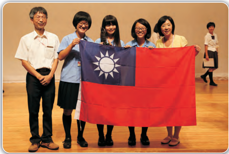
2014日本靜岡青少年科學工程論壇(SKYSEF)專題研究報告環境組第一名