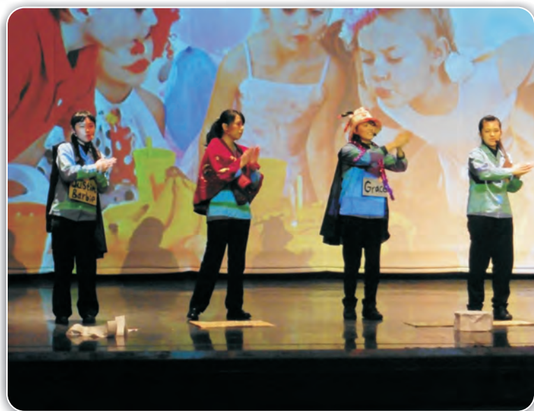
國立蘭陽女子高級中學103學年度英語團體說故事比賽