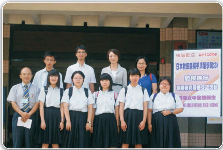
2014日本拱橫清陵學院科學交流活動