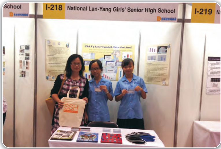
2014代表台灣參加日本SSH(超級科學高中)科學論壇