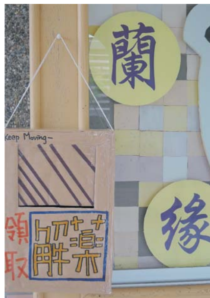
▲人事室旁的公告欄上的回信信箱