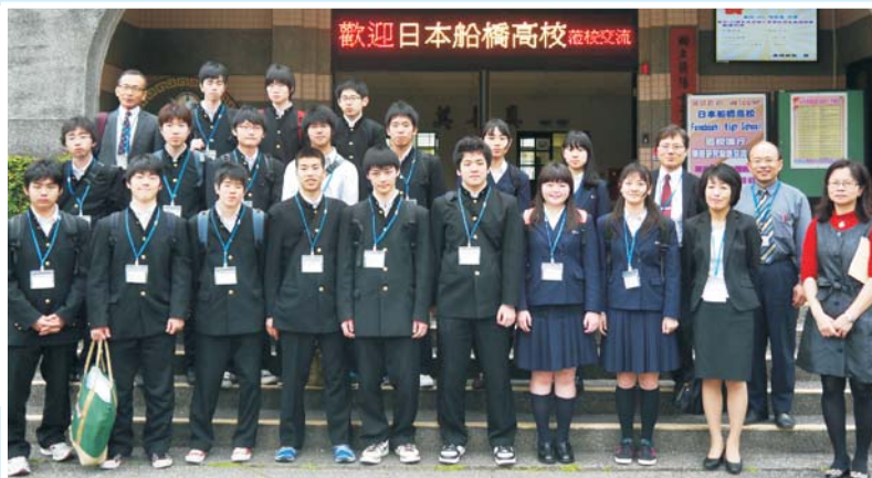
▲船橋高校師生蒞校訪問