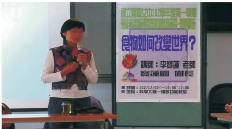
主講人：寶蓮園李寶蓮園長 講題：食物如何改變世界？