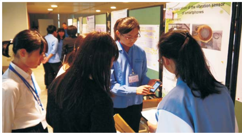
▲兩校同學進行科學交流