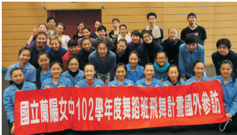
▲訪問日本神戶女子學院

五天的「飛舞計畫—日本行」同學們經驗了日本高科技的設施、災後重建的力量、傳統文化古城寺廟的建築，還有已提高到藝術層次的茶道與和服秀，更領受到他們對舞蹈藝術的專業態度與認真的精神，參與此行的師生皆滿載而歸，那是精神上的滿足和知識上的充實，感謝學校給予舞蹈班這個寶貴的機會，相信這必是他們學習路上最珍貴的回憶。