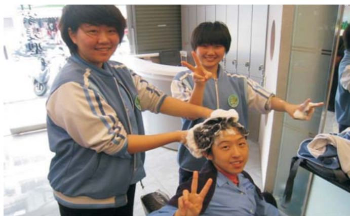
◀宜蘭名家髮廊職場體驗活動

程從遊戲中學習團體合作、探索生涯興趣，到美髮院實習，同學們都覺得很有趣，能實際從做中學，並期待學校能多參與這樣的活動。其中有2位應屆畢業生事先報名就業力培訓計畫，此計畫可於畢業後參加職訓課程，並進入職場實習，可領實習津貼，對於想要就業的同學是另一種選擇。