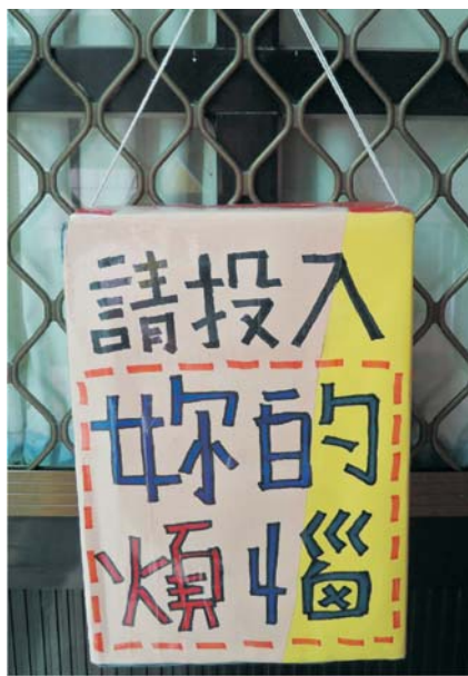
▲團體輔導室門口上的收信信箱

「解憂雜貨店」願意為你效勞！只要把你的煩惱寫下來，投進團輔室（輔導室旁）門上的小信箱，我們將會以真誠的心回覆你。（小提醒：可以指定解憂者，不願透露姓名也可以匿名喔！）