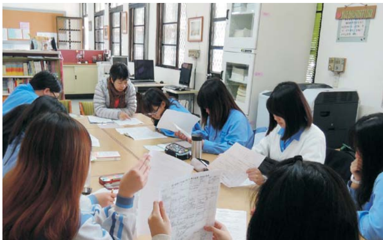
▲由9位成員與2位輔導老師共同參與

KEEP MOVING這學期的重頭戲是「解憂雜貨店」的活動，有煩惱卻說不出口？想要一些小小的解決意見？