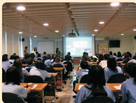
再現同安船紀錄片巡迴講座 102年05月21日 研習心得：重回歷史現場，進行實物考察，再以考據、模型與紀錄片還原歷史、再現歷史。