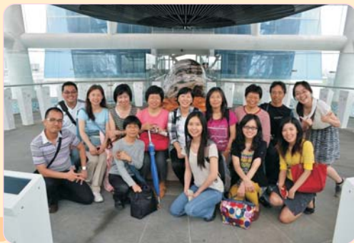
英文科校外參訪 102年5月10日 參訪地點：世博臺灣館、湖口老街。 參訪內容：世博館導覽與介紹。 參訪目的：利用在地文化介紹與自然景觀導覽、在地產業的轉型及發展探索，發揮探索精神，使地方與國際接軌，開創語文新生命。