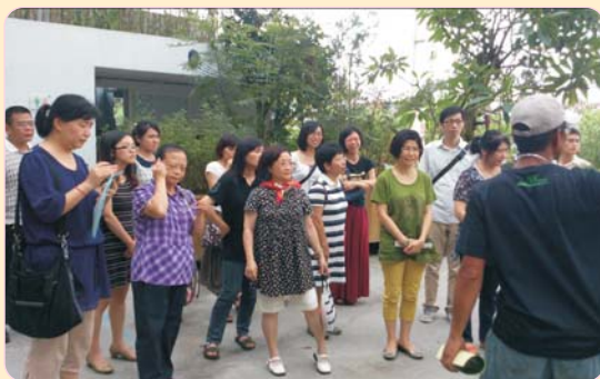
國文科校外參訪102年6月26日 參訪內容：香草菲菲芳香植物博物館 研習心得：身臨其境，將自然與文學做進一步結合，體會人間處處是文學。