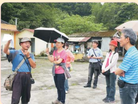
社會科校外參訪 102年5月9日 研習心得：參訪福山植物園與雙連埤自然環境，體驗台灣自然生態之美、人與自然的和諧相處之道，進而提升學生對