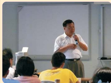
科展經驗談與交流研習102年5月10日 研習主題：科展經驗談 研習心得：從平凡處找到深入研究的入切點，激勵學生，引發主動學習的動力。