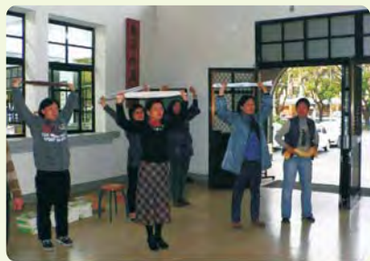
全校師生於每星期一、四第七節下課實施毛巾操活動，舒解壓力