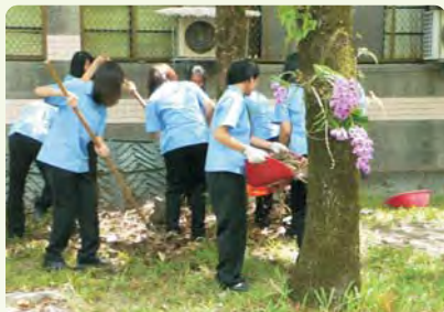
高一清理落葉堆肥箱作業