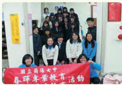
春暉社至創世基金會擔任志工