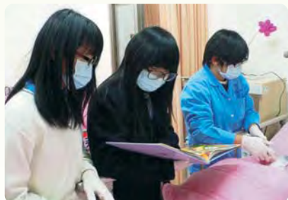
說故事給病患聽，安撫病患情緒