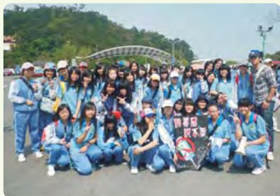
高一校外教學反毒宣導活動