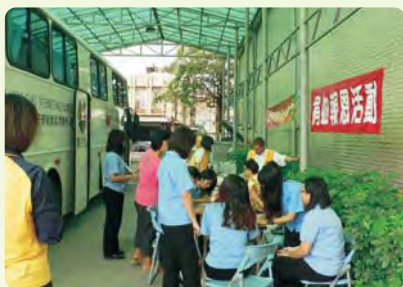
捐血報恩活動—關懷社會