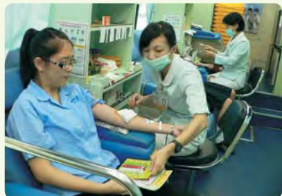
學生挽袖捐血情形