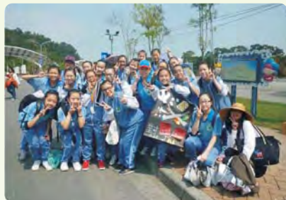
高一校外教學反毒宣導活動