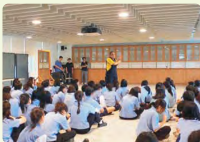
安全研習—女子防身術