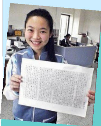
312 班柯宜均學測作文入選大考中心佳作範例