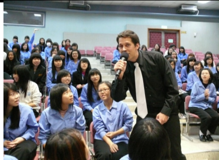
空中英語教室列車演講