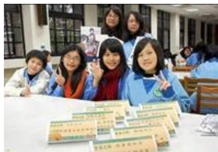
每位同學皆有「書名」，互動「閱讀」

目前全球已有三十多個國家響應真人圖書館；日本東京大學有真人圖書館的聯絡處，中國大陸也有真人圖書館的構想，台灣已邁入多元化的社會，一個人就是一本好書的活動，在蘭女首開先鋒，期盼同學借一本「真人」閱讀，可以解除心中的疑惑，可以找到興趣相似的同好，培養多元學習力。