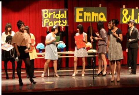
高二英語話劇比賽 206 班得冠!