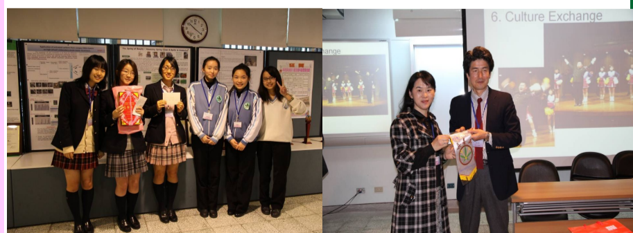
101. 3. 12 日本早稻田本庄高校師生蒞校參訪，與蘭園師生經驗分享

本校 100 年度再度獲國科會選為高瞻計畫第二期的執行學校，將以雲端科技為主題，用小電腦做大科學。課程發展分為「大雲朵」、「小雲朵」教學。建立簡易雲端平台，即小雲朵；校方並與中央研究院地科所、台師大合作，運用網路中心的雲端資料庫，建立蒐集與分析地震資料的雲端平台的「大雲朵」，透過運算分析，培養學生科學研究能力；另一方面延續原高瞻團隊開發之綠色能源科技課程，提供本校發展課程及教材教法的經驗，進而推廣至縣內其他高中職學校共同參與。在教師團隊積極互動與多方資源挹注之下，除提升師生研究風氣，於各項科學競賽中屢獲亮麗成績。