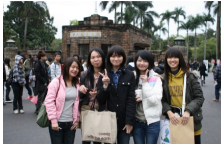
100 學年度校外參觀 台大杜鵑花節