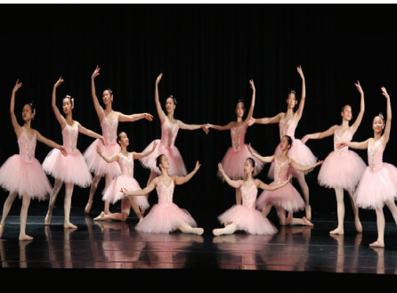
蘭陽女中舞蹈班冬季舞展