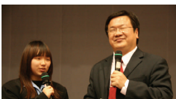
戴晨志老師蒞校演講

邀請戴晨志老師蒞校演講，同時舉辦會後心得寫作比賽，在大師的心靈對話過程中，同學反應熱烈，在精彩的演講中提升內涵。