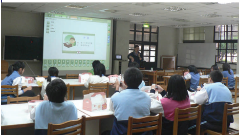
跨校科普達人擂台賽