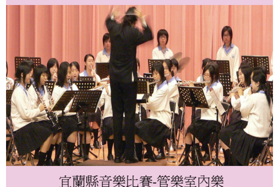
宜蘭縣音樂比賽-管樂室內樂