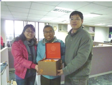
蘭園女孩志工服務--家扶中心