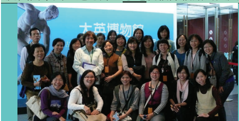
社會科及國文科參觀「大英博物館珍藏展」