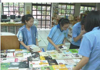
博客來全國聯合巡迴書展

爲了提升自我學習能力，本學年圖書館志工群共同閱讀《學習才是王道》一書，參與以讀書會形式的討論與分享，作爲志工的培養與訓練課程。接下來志工實踐包含了圖書雜誌上架、主題書展布置、教家扶中心小朋友做馬克杯，每位志工同學都感到充實愉悅。