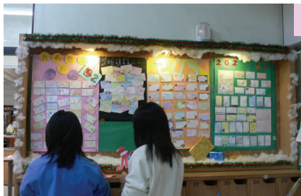
班級讀書會 主題書展布置

圖書館每學年都會召集志工，一年內熱心服務者頒發發義工證書，歡迎來圖書館做志工服務！ 打開閱讀視野 參與豐富活動 圖書館爲了推廣閱讀，結合社區及其他學校一同活動。相關活動有鼓勵老師閱讀的「教師好題贈好書」活動，再由各校老師鼓勵學生閱讀並上網做線上閱讀檢測，最後各校一起進行「跨校科普達人擂台賽」。英文閱讀方面，鼓勵學生利用線上資源練習英文能力外，另辦理「與外國學生對談」研習，與外國學生做文化交流，得到極大迴響與收穫。