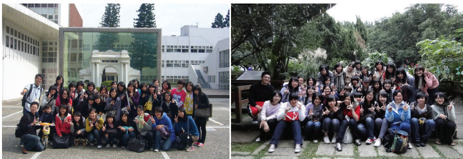
數理及語文班參訪國立清華大學及師範大學

鼓勵學生將學習場域延伸至校外：99/12/11 數理及語文班參訪國立政治大學、清華大學及師範大學。藉由各大學豐富多元的活動與校系介紹，拓展視野，開闊胸襟，並提早做好生涯規劃。