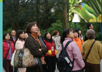
參觀植物園生態—喜見五色鳥