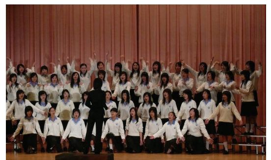
宜蘭縣音樂比賽-合唱團