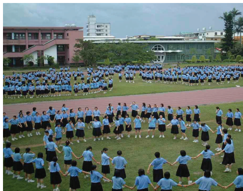
九十九學年度下學期家長會消息