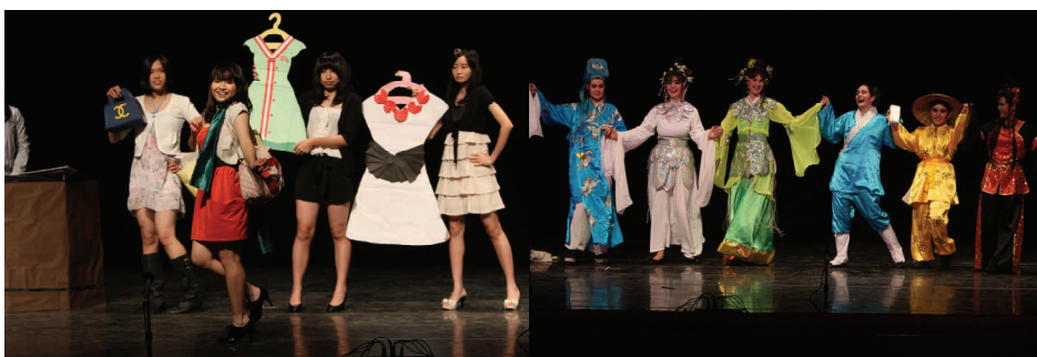
212 班演出 Shop Till I Drop 外籍生粉墨登場-新白蛇傳

為提升學生英文學習成效，鼓勵創意教學，每年均舉辦英語話劇比賽。99/12/22 共計高二社會組七個班參賽，由 212「Shop Till I Drop」奪得團體第一名。各班編、導、演均由學生一手包辦，表現亮眼，令人驚豔。而 6 位來自法國、德國、俄羅斯、巴西、厄瓜多及斯洛伐克的交換學生，則以台灣本土歌仔戲的唱腔及裝扮演出「新白蛇傳」，認真逗趣的演出博得滿堂彩，也展現了文化融合的和諧意境。