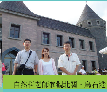
自然科老師參觀北關、烏石港