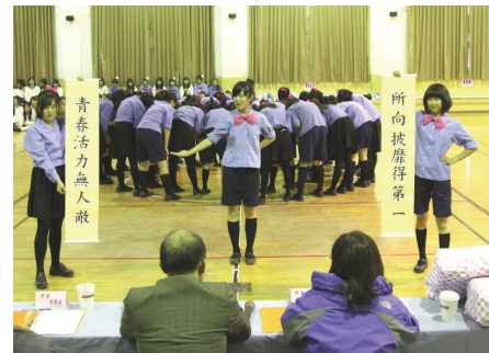
青春活力的高一班際土風舞比賽