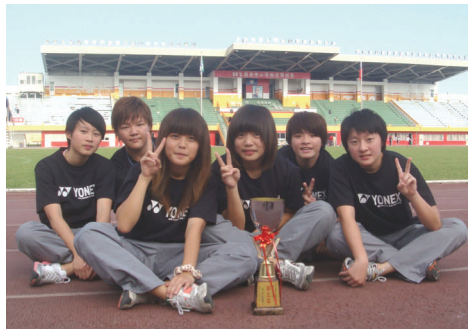
宜蘭縣運動會 田賽第二名、徑賽第三名