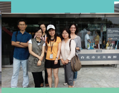
藝能科老師參觀費城美術館經典展