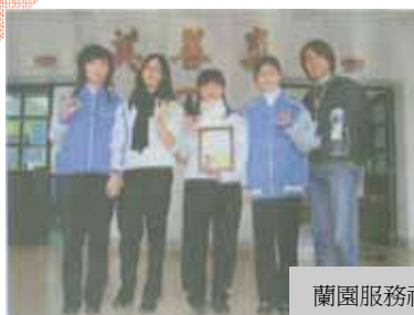
蘭園服務社重要成員

這份行善的心意在學校引起極大的共鳴，加入志工行列的藍衫女孩也愈來愈多，其中，有些同學一度受到家庭的阻力，但經過觀察、溝通，連同家人也轉為支持，主動協助募款等相關活動。蘭園這股關懷與愛的力量，讓許多人生命更豐盛。