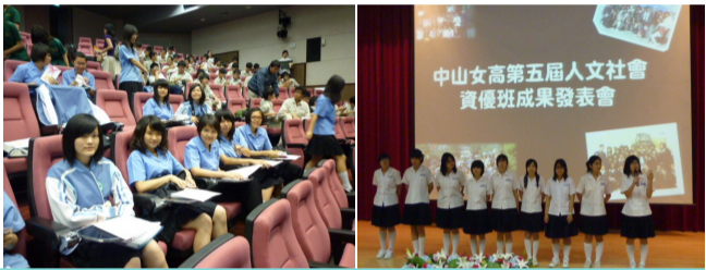
觀摩「中山女中人文社會資優班」成果發表

在多元學習中，鼓勵學生將學習場域延伸至校外：5/28 觀摩「中山女中人文社會資優班」成果發表。拓展學習視野，深植人文素養，啟發學生多面向的思維模式及成就動機。