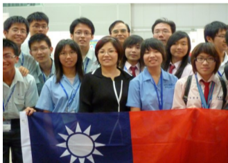
台灣十八位金牌得主領獎時，贏得全場熱烈掌聲