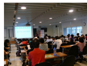
生物科教學評量命題實務和試題分析與應用