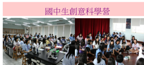
國中生創意科學營

為了讓國中生提早了解高中課程，激發學習興趣，達到就近入學之目的，邀請縣內國中應屆畢業學生，參加本校舉辦的「創意科學營」。今年的主題有：生活中的奈米科學、有趣的多媒體影像世界、天文觀測與夏季星空、數學中的摺紙美學等。