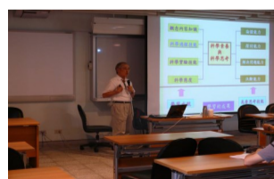
英文作文教學研討