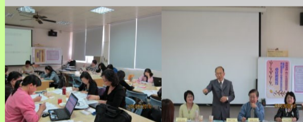
健康與護理學科 九十九學年度種子教師春訓

並提供教材與教學資源作為各分區及縣市辦理增能進修之教材，充實及活化學科中心網站平台服務功能。舉辦各項研討會、座談會，研發多元的教學內容，提升教學效能。