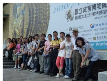
社會科及國文科 參觀故宮勝地西藏特展