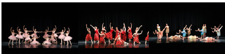
舞蹈班舞作－華麗年代 舞蹈班舞作－青春的願望 舞蹈班舞作－旅程

此次的演出共推出十支舞碼，星空、華麗年代、青春的希望；融合芭蕾舞技巧和現代敘事的現代芭蕾舞作浮水·印；氣勢磅礴、撼動人心的武功作品－奔騰、望海；展現女性嬌柔體態的身段作品－落梅風；用肢體表達情感的現代舞作－落塵、旅程、女人皆如此。誠摯的邀請您蒞臨觀賞。