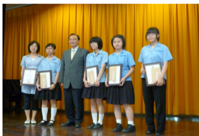
全國科展優異獲宜蘭縣長表揚