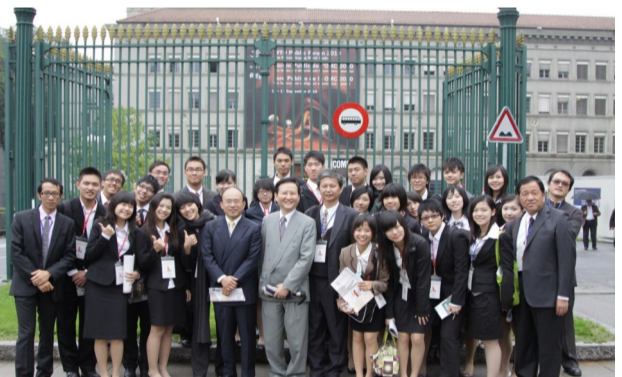
二十一世紀領導人才歐洲參訪